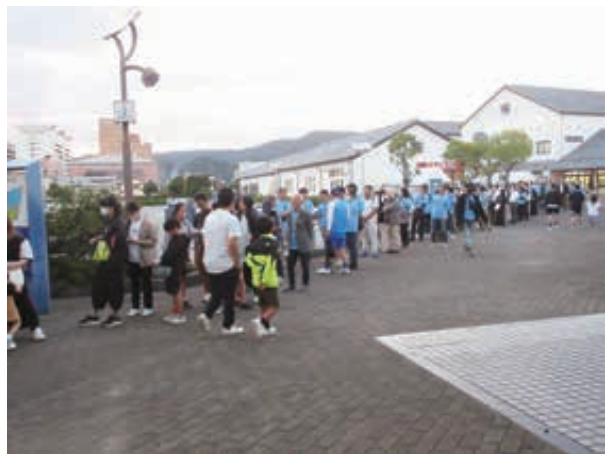
写真1 開幕戦観客入場前の様子 (2023.10.6)

いた。まるでロックのライブ会場にいるような感じで、あっという間にゲーム終了を迎えた。80-91 での敗戦となり少し残念な気持ちがあったが、「観にきてよかった」との感想を持った。会場を出る観客をみると、ニコニコ笑顔にあふれている方が多い印象を受けた。