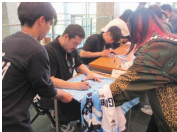
写真 3 交流イベントの様子（2024.5.18）

上記はクラブが主催したものだが、ほかでもさまざまなイベントが行われてきた。阿波銀行では、5/18（土）、8/24（土）の 2 回、プレーヤーを招いたイベント（トークショー、交流会、サイン会、クイズ大会など）を本店営業部内あわぎん BASE において開催した。このようにファン・ブースターとプレーヤーそしてクラブとの接点が多く設けられてきており、「おらがまちのクラブ」「わたしたち県民に近い存在のクラブ」のイメージを定着させる活動が続けられてきた。