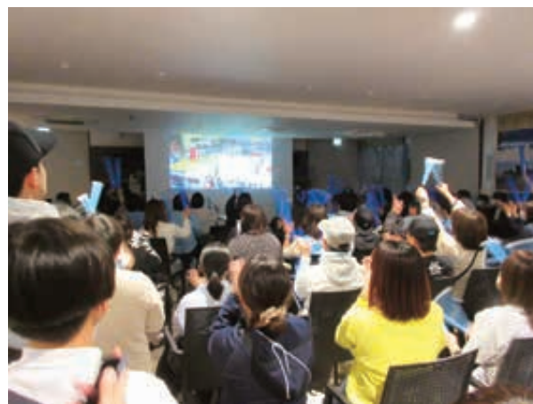
(場所：松茂町交流拠点施設 Matsushigate (マツシゲート))

この結果、2024-25 シーズンも引き続き B3 リーグで戦うこととなった。当然ながら、プレーオフに進出し上位 2 チームまでに勝ち残って、B2 リーグ昇格をぜひとも成し遂げてもらいたいと願っている。