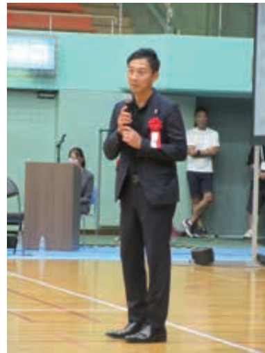
（場所：とくぎんトモニアリーナ 徳島市立体育館）

うことが指摘されている。地方の人口減少とそれに伴う衰退が進んでいる現状は承知しているが、Bリーグはこれに歯止めを掛け地域を盛り上げることを行動理念としている。」